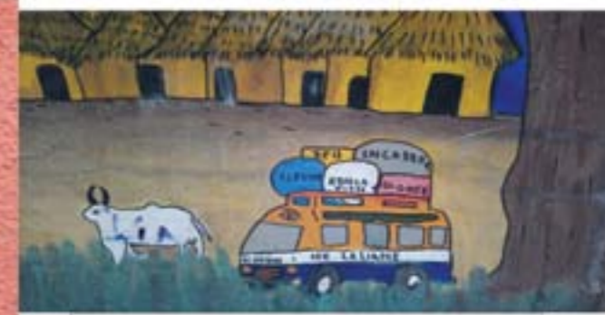
Centre d'accueil La LIANE