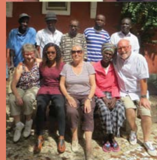
Le personnel du centre